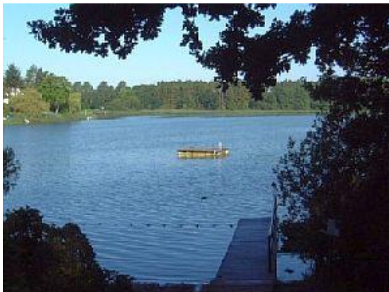
Abbildung 1: Bild der Badestelle

Die Badestelle ist am Jugendzeltplatz gelegenen und entsprechend stark ist die Frequentierung während der Ferien. An der Badestelle gibt es keine Liegewiese o.ä., der Uferbereich ist sandig, die Sohle flach abfallend.